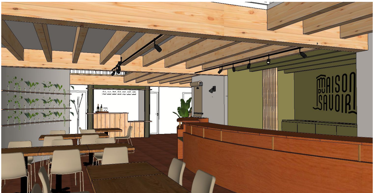
Vue du bar en RDC – Mise en situation