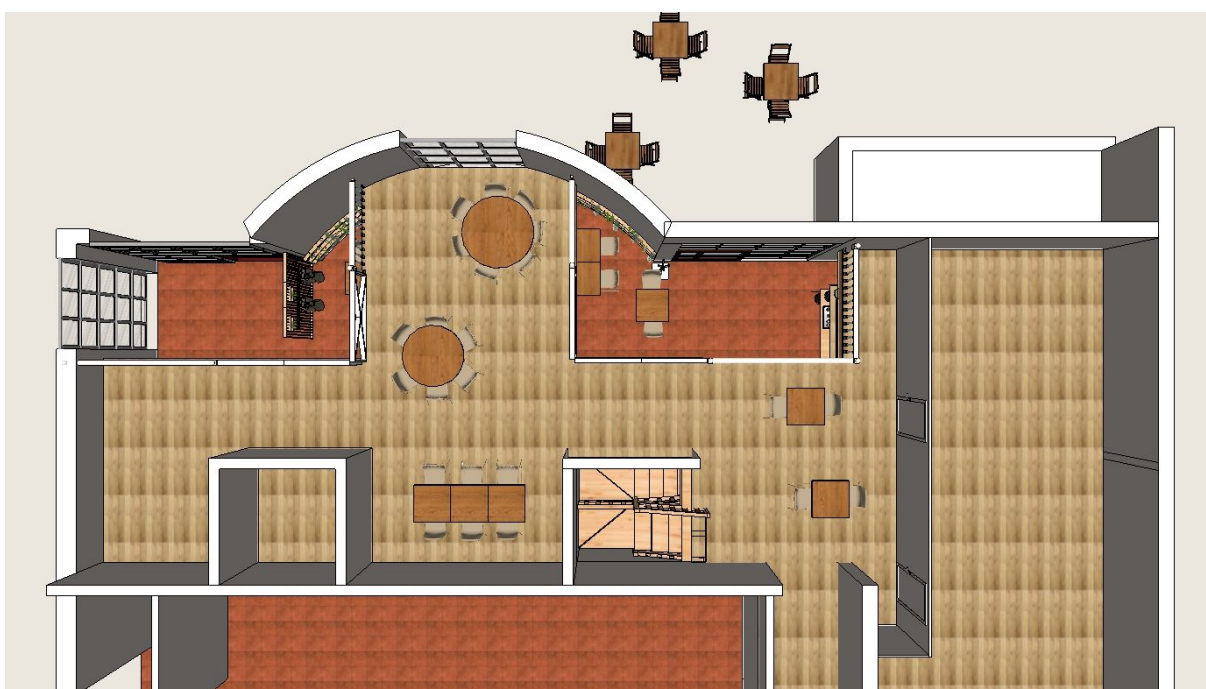
Vue de la salle en mezzanine