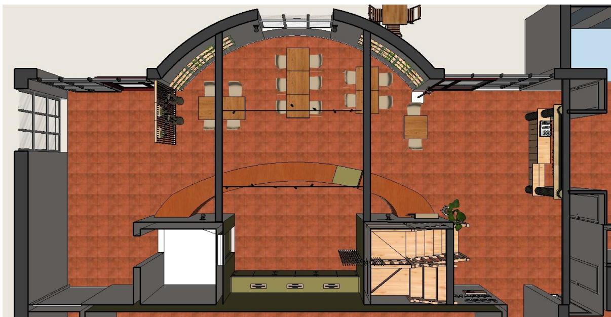
Vue de la salle en RDC