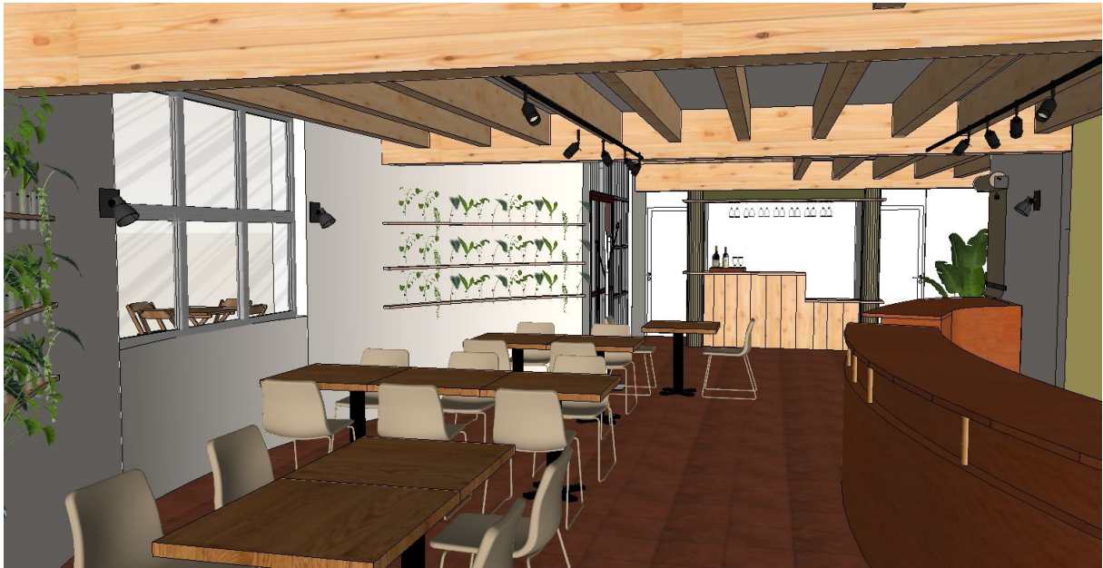
Vue de la salle en RDC – Mise en situation